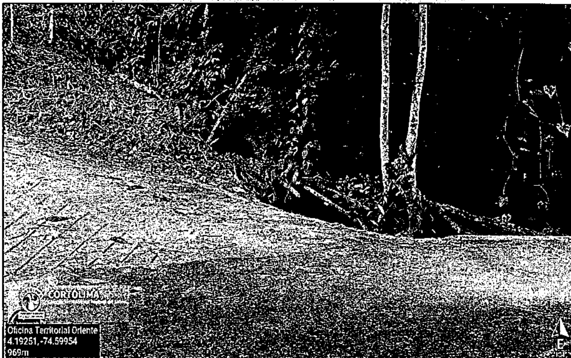
Fotografía No 3. Se desistió de la obra y esta no tuvo continuidad sobre la servidumbre o espejo de agua.