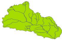
Figura 67. Distribución porcentual (%) en hectáreas de la cobertura y uso actual de la tierra en la cuenca del río Anamichú.