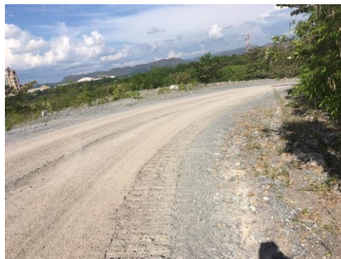
Fotografía 5. Tramo de la vía por donde transita maquinaria pesada de CEMEX y comunidad usuaria

De acuerdo con la información recopilada, respecto a la frecuencia de uso, se determinó que el 73,1% de los usuarios entrevistados hacen uso a diario del sendero rural; el 8,5% lo hacen con una frecuencia semanal y mensual, mientras que el 9,9% no tiene un periodo determinado para pasar hacer uso del sendero. Así mismo, fue posible determinar que en la mañana sube un 37,7% de usuarios y en la tarde descienden un 39,4%, un 11,5% manifestó utilizar el camino al medio día para dirigirse a almorzar a Payandé, con un porcentaje del 11,5% y un porcentaje similar (11,5%) manifestó no tener una hora específica para hacer uso del trayecto.