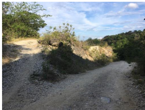
Fotografía 7. Punto de conexión del camino veredal (izquierda) con la carretera de acceso a Payandé (derecha)

Respecto al medio utilizado, los usuarios entrevistados manifestaron usar mayoritariamente la moto para transportarse por los caminos, con un porcentaje del 70,3%, seguido de quienes van a pie, que representa el 21,6% y en menor porcentaje se encuentran quienes se desplazan en bicicleta, con un 2,7%. Sin embargo, vale la pena mencionar que solamente los medios de transporte anteriormente mencionados permiten hacer la conexión a través del uso de esta servidumbre (a pesar que no se encuentra considerado el uso de motocicletas) pues la utilización de vehículos se encuentra imposibilitada.