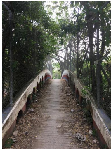
Fotografía 4. Puente Mular acceso a camino de uso comunitario

Si bien es cierto, al hacer uso de este camino que cruza por el interior de la mina La Esmeralda, hay una reducción en los tiempos de desplazamiento, es necesario tener en cuenta que la circulación en un espacio compartido con vehículos que hacen parte de la operación minera, configura un escenario que implica un alto riesgo de accidentalidad, sobre todo si se tiene en cuenta que la comunidad se desplaza por las zonas de la mina sin aplicar las medidas de seguridad respectivas, privilegiando los beneficios de su utilización en tiempo, para los usuarios en general independiente le medio por el cual se movilicen, especialmente para los motociclistas puesto que esta reducción en tiempo a su vez se traduce en dinero, pues hay una reducción importante en costos de combustible y vida útil de los vehículos al ser menores los desplazamientos. Sin embargo como se mencionó anteriormente, no está considerado este tipo de vehículo para su utilización.