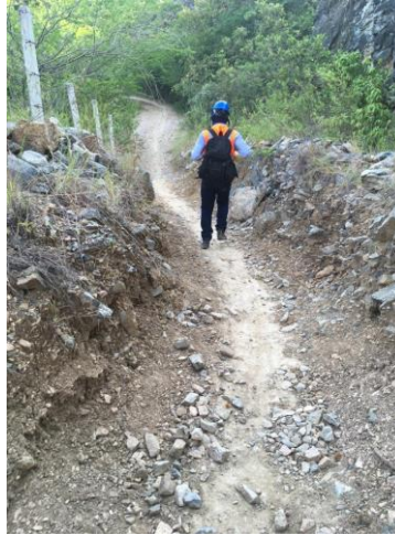
Fotografía 6. Tramo del camino apto para circulación peatonal

Payandé, por razones estrictamente laborales, como se mencionó, principalmente por quienes trabajan en las pequeñas mineras y algunas fincas de ganadería, mientras que el 9,4% dijeron manifestaron su utilización porque su lugar de residencia se encuentra pasando la mina la Esmeralda, el otro 9,4% lo utilizan para recreación como lo son: el bicimontañismo, fincas de descanso y la recreación paisajística.