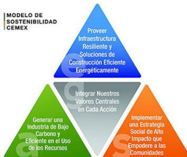
Figura 1. Modelo de Sostenibilidad de Cemex

CEMEX Colombia S.A. en su Modelo de Sostenibilidad, se encuentra comprometida a llevar a cabo actividades de negocio de una manera sustentable y ambientalmente responsable. A través de un proceso estructurado y extenso de consulta interna y externa, define los principales objetivos de sostenibilidad bajo cuatro pilares: Económico, ambiental, social y de gobernanza. Estos, con el apoyo de trece prioridades que aseguran la integridad del valor sostenible en todos los aspectos del negocio. Ver Figura 1