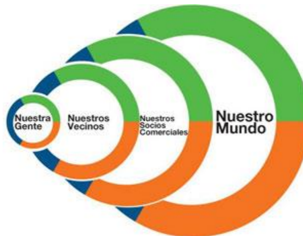
Figura 3. Grupos de Interés

Cemex está convencido de que la prosperidad de la compañía está estrechamente vinculada con la prosperidad de los grupos de interés . Ésta es la filosofía que sustenta la visión de ser la compañía más respetada por grupos de interés. Ver Figura 3